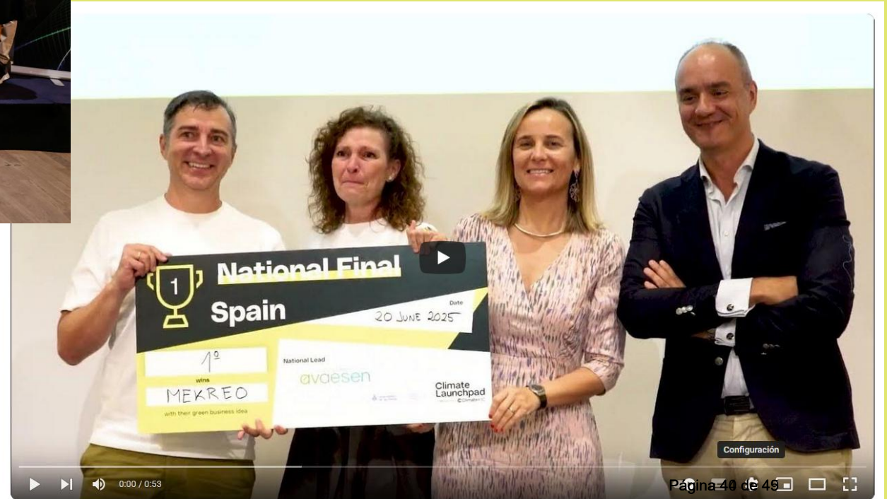
Vídeo resumen de la final nacional de ClimateLaunchpad 2025